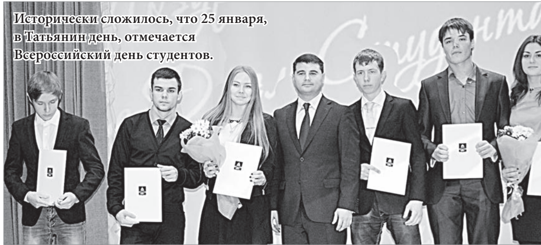
Исторически сложилось, что 25 января, в Татьянин день, отмечается Всероссийский день студентов.