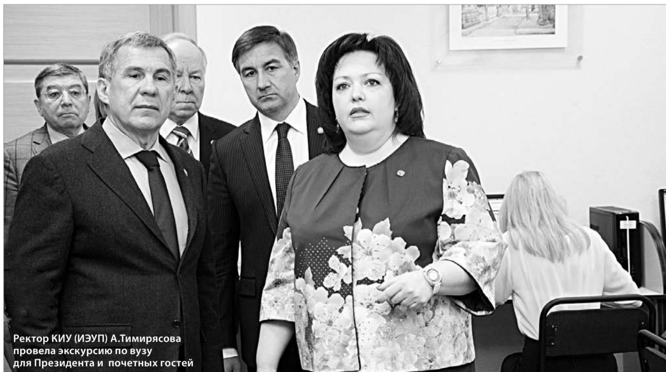
Ректор КИУ (ИЭУП) А.Тимирязова провела экскурсию по вузу для Президента и почетных гостей