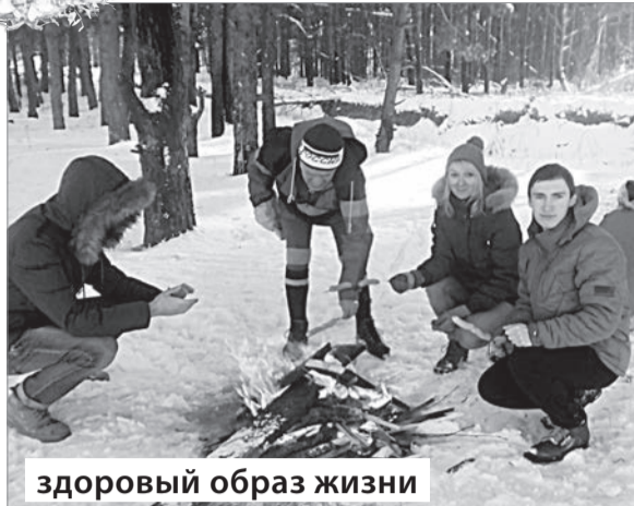
здоровый образ жизни