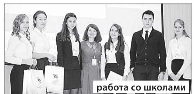
работа со школами