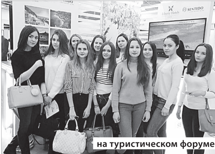
на туристическом форуме