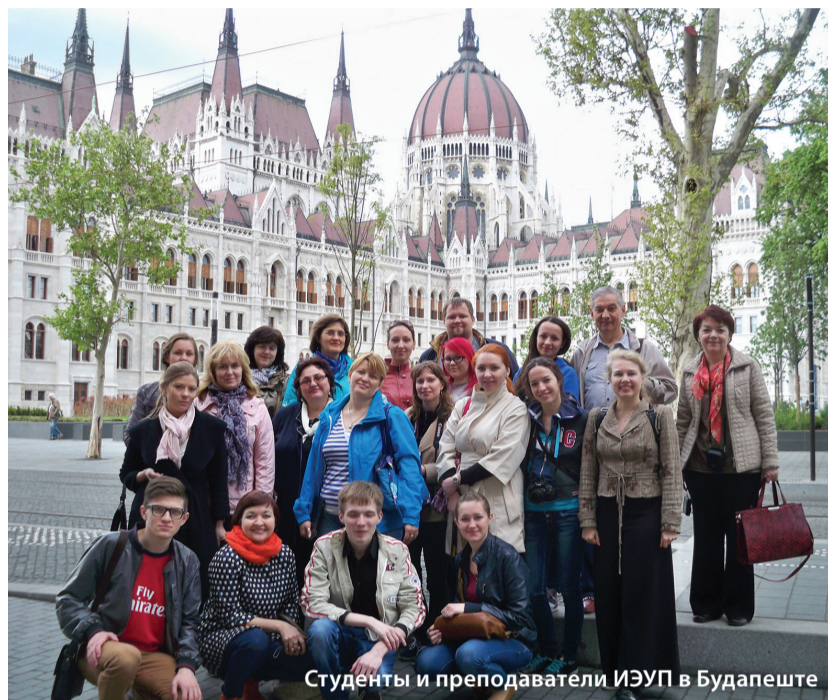
Студенты и преподаватели ИЭУП в Будапеште

Такое взаимодействие обогащает образовательную деятельность, повышает кругозор и компетенцию как преподавателей, так и студентов.