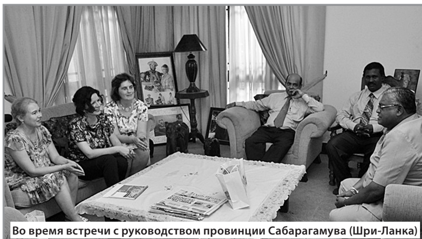
Во время встречи с руководством провинции Сабарагамува (Шри-Ланка)