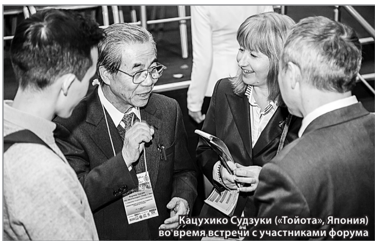
Каучики Судзуки («Тойота», Япония) во время встречи с участниками форума