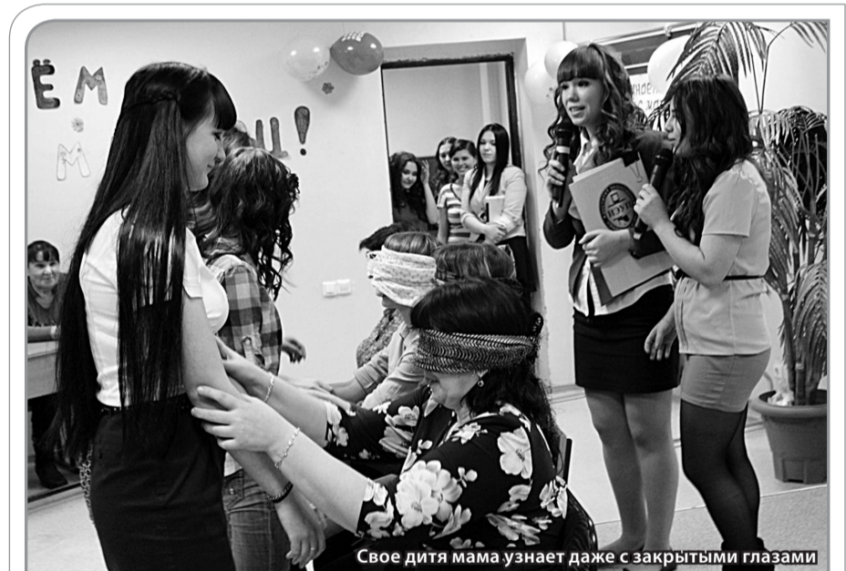
Свое дитя мама узнает даже с закрытыми глазами