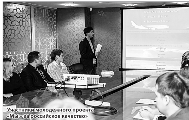
Участники молодежного проекта «Мы – за российское качество»