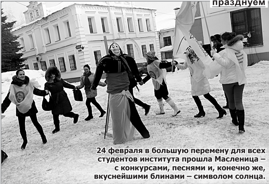
24 февраля в большую перемену для всех студентов института прошла Масленица – с конкурсами, песнями и, конечно же, вкуснейшими блинами – символом солнца.