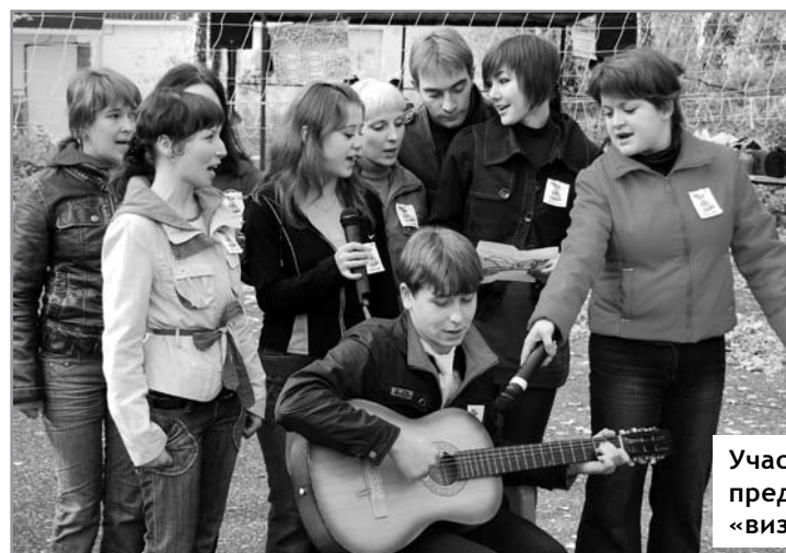
Участники представляют «визитку»

Вердикт жюри таков: право называться лучшей группой юрфака завоевали первокурсники группы 281, старосте которой был вручен диплом и сладкий приз. В различных номинациях 7 студентов получили дипломы за активное участие в Дне юриста.