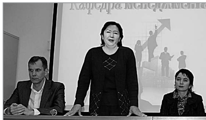
На конференции по

В преддверии «Недели» было проведено анкетирование студентов с целью выявить их мнение о вузе. Отрадно, что ребята любят свой институт, гордятся им. Кстати, самыми активными участниками в проведении Недели факультета были именно студенты. Они предлагали интересные идеи на деловых играх, блестяще выступили на олимпиадах и заседаниях научного кружка, подготовили стен-