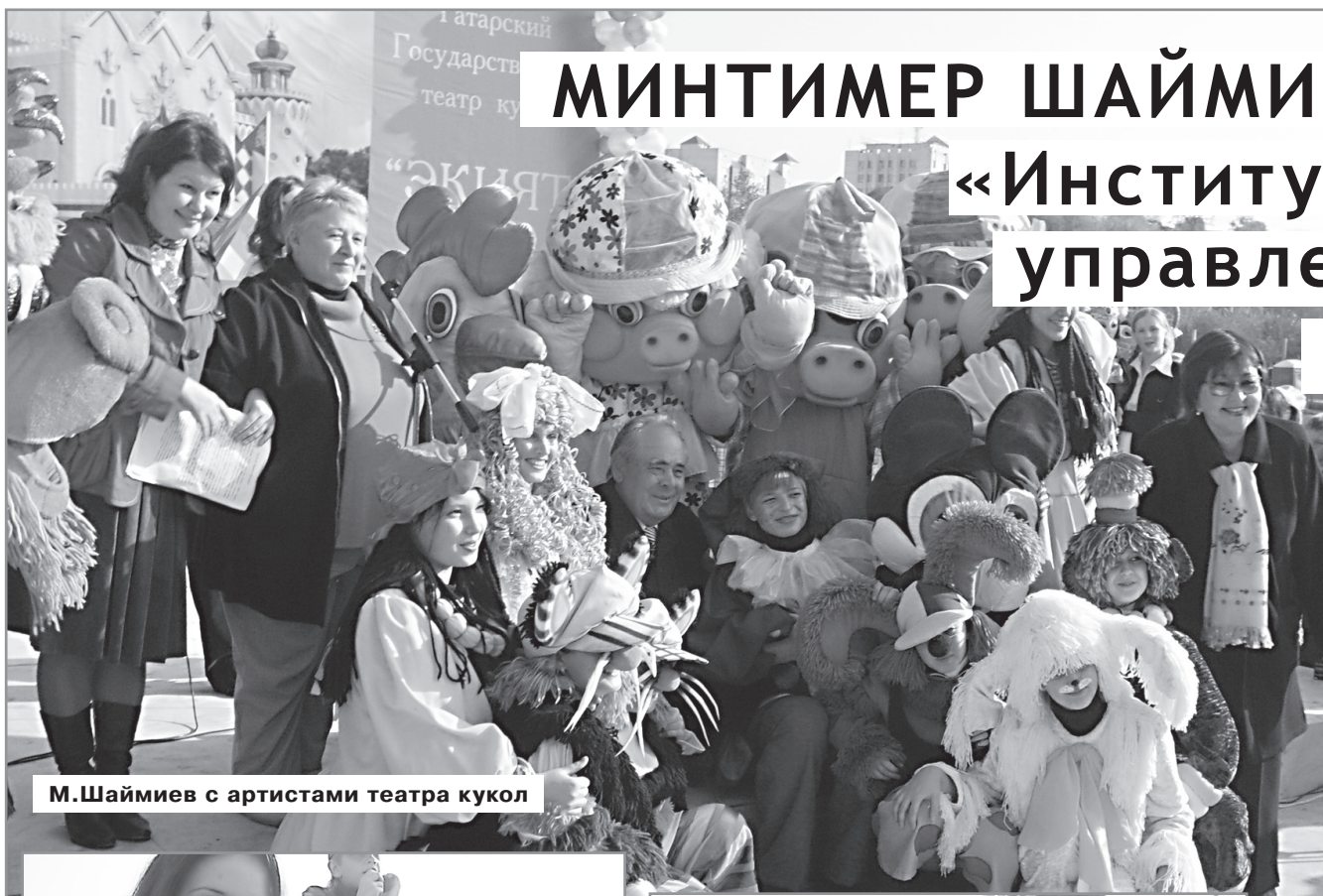
М.Шаймиев с артистами театра кукол