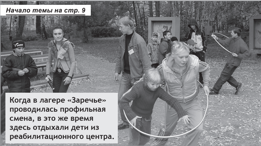
Начало темы на стр. 9

Когда в лагере «Заречье» проводилась профильная смена, в это же время здесь отдыхали дети из реабилитационного центра.