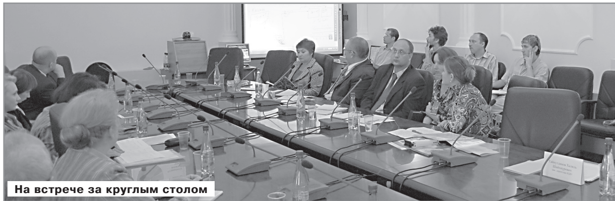
На встрече за круглым столом