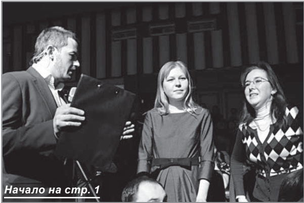
Начало на стр. 1