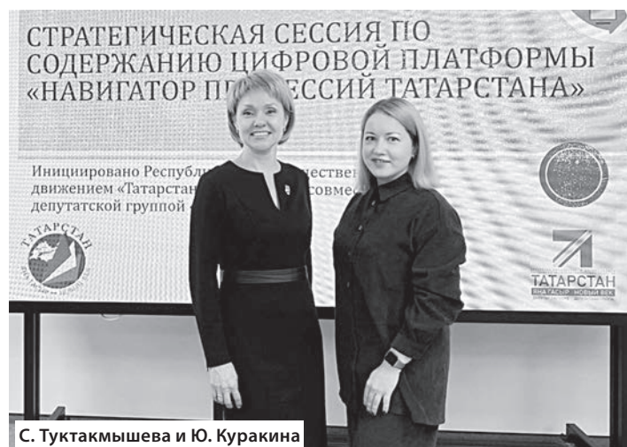
С. Туктамышева и Ю. Куракина