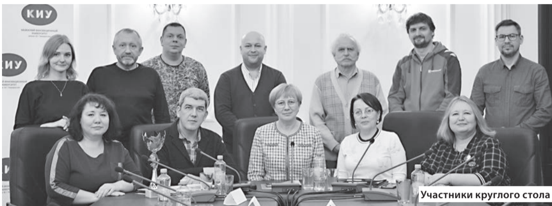
Участники круглого стола

ственный университет, Алтайский государственный университет (Барнаул) и другие вузы страны.