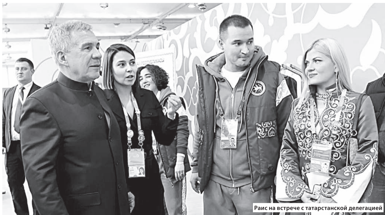
Раис на встрече с татарстанской делегацией

20 тысяч активных молодых людей из 189 стран собрались на федеральной территории «Сириус», где с 1 по 7 марта проходил Всемирный фестиваль молодежи и студентов.