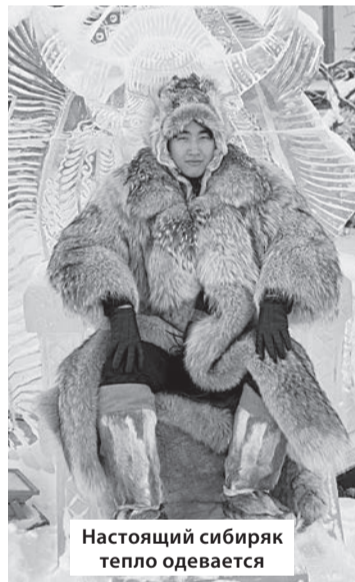
Настоящий сибиряк тепло одевается