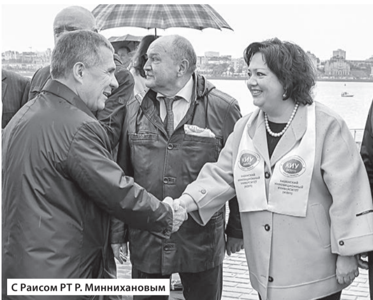
С Раисом РТ Р. Миннихановым