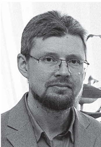
Камиль Шамилович Еникеев