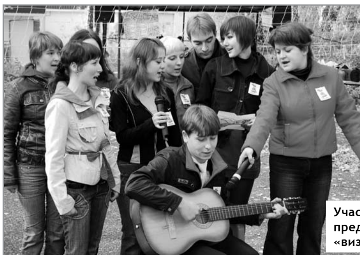
Участники представляют «визитку»

Вердикт жюри таков: право называться лучшей группой юрфака завоевали первокурсники группы 281, старосте которой был вручен диплом и сладкий приз. В различных номинациях 7 студентов получили дипломы за активное участие в Дне юриста.