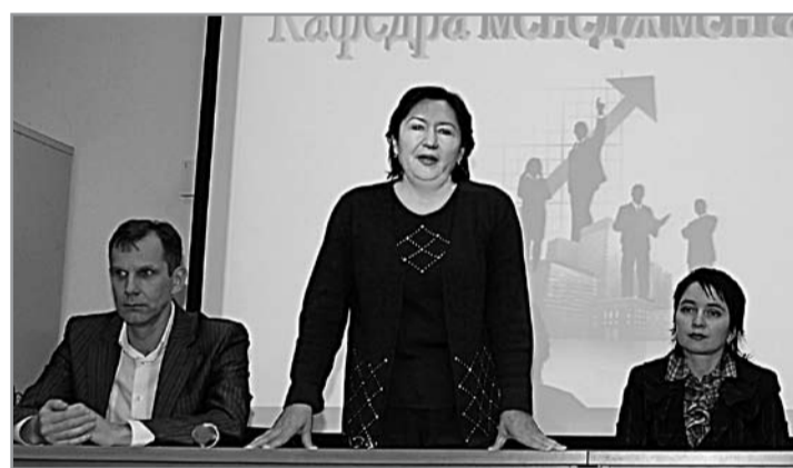
На конференции по

В преддверии «Недели» было проведено анкетирование студентов с целью выявить их мнение о вузе. Отрадно, что ребята любят свой институт, гордятся им. Кстати, самыми активными участниками в проведении Недели факультета были именно студенты. Они предлагали интересные идеи на деловых играх, блестяще выступили на олимпиадах и заседаниях научного кружка, подготовили стен-