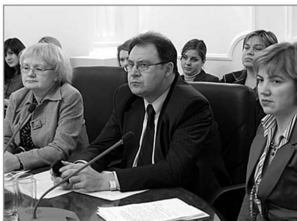
Замминистра по делам молодежи, спорту и туризму А. Березинский