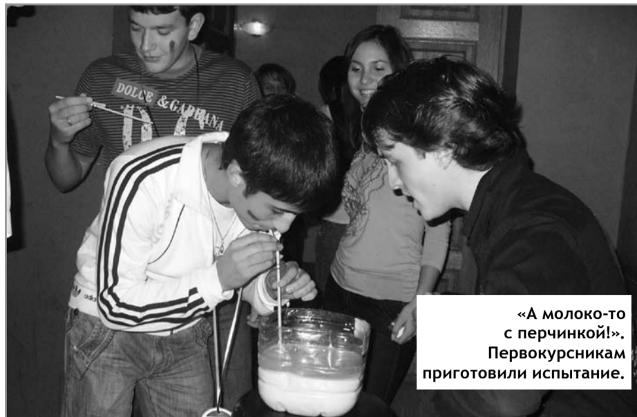
«А молоко-то с перчинкой!». Первокурсникам приготовили испытание.

Концертную программу открыло вокальное трио «Минус версия», солистки которой – студентки 4 курса – песней «Детство» еще раз напомнили, что детство, как бы печально это ни звучало, прошло и впереди самостоятельная жизнь. Остальные концертные номера представили исключительно первокурсники – участники