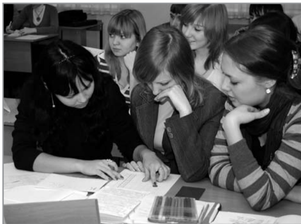
Во время деловой игры

Событием ноября стало масштабное и представительное мероприятие, которое проходило в институте, - Неделя факультета менеджмента и маркетинга.