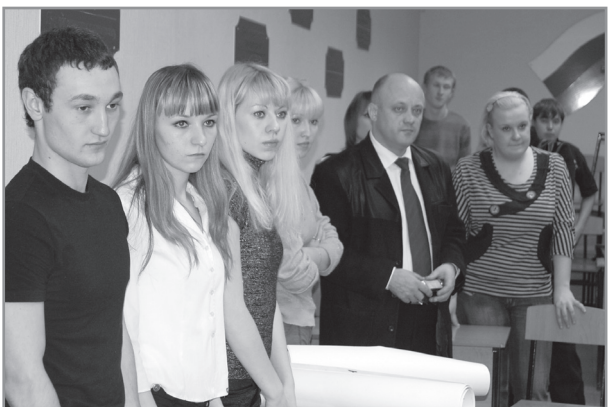
Оглашение вердикта присяжных

Неделя юридического факультета, которая прошла в головном вузе, вместила в себя множество значимых мероприятий. Она приурочена к всероссийскому празднику – Дню юриста, который с этого года отмечается 3 декабря.