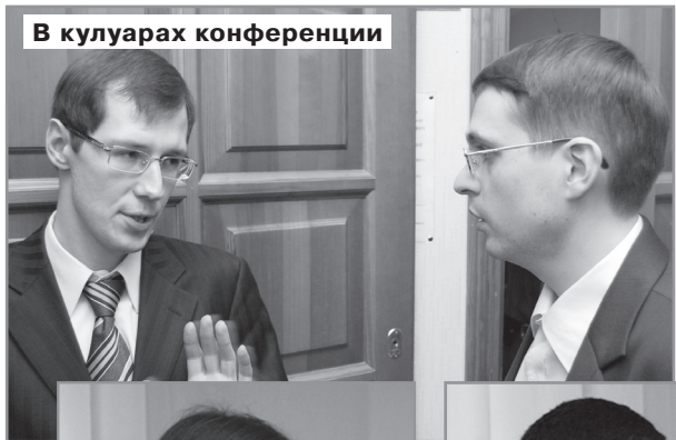
В кулуарах конференции