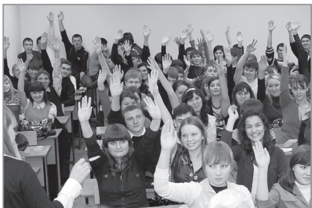
Диспут «Смертная казнь: за или против»