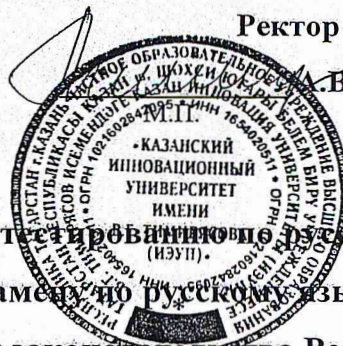
График тестирования по Государственному тестированию по русскому языку как иностранному и Комплексному экзамену по русскому языку как иностранному, истории России и основам законодательства Российской Федерации (2020 – 2021 учебный год).