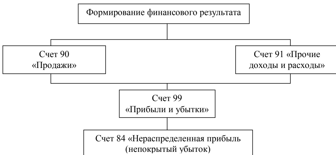
Рис.1. Порядок формирования конечного финансового результата