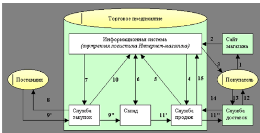
Рис. 2. Организация и управление продажами Интернет-магазина