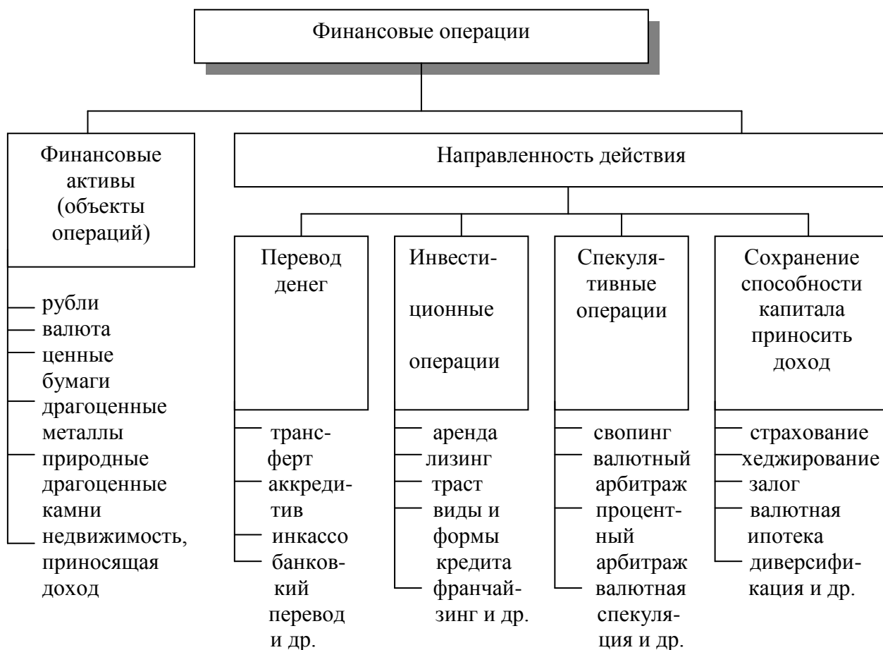
Рис. 1.2.3. Классификация финансовых операций [21]