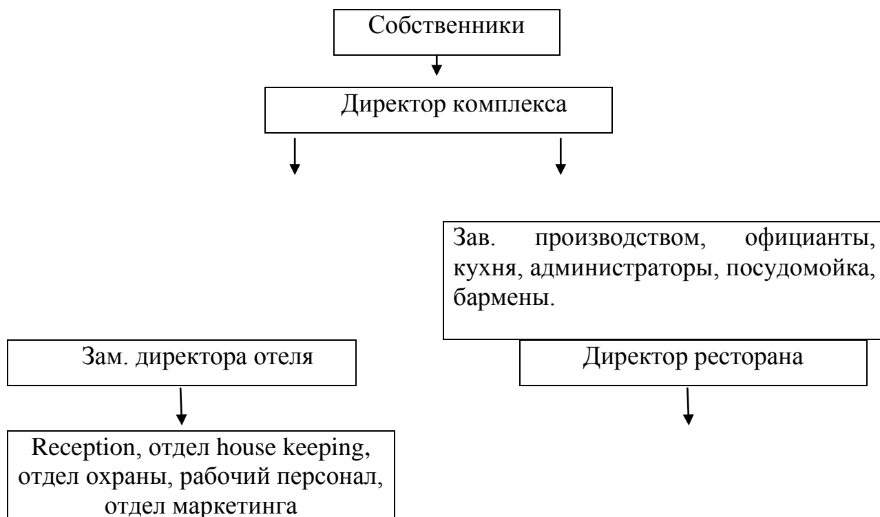
Рис. 2.1.1. Структура управления гостиницей «Булгар»

Представим и охарактеризуем далее организационную структуру гостиницы. Организационная структура отеля представлена на рисунке 2.1.1.