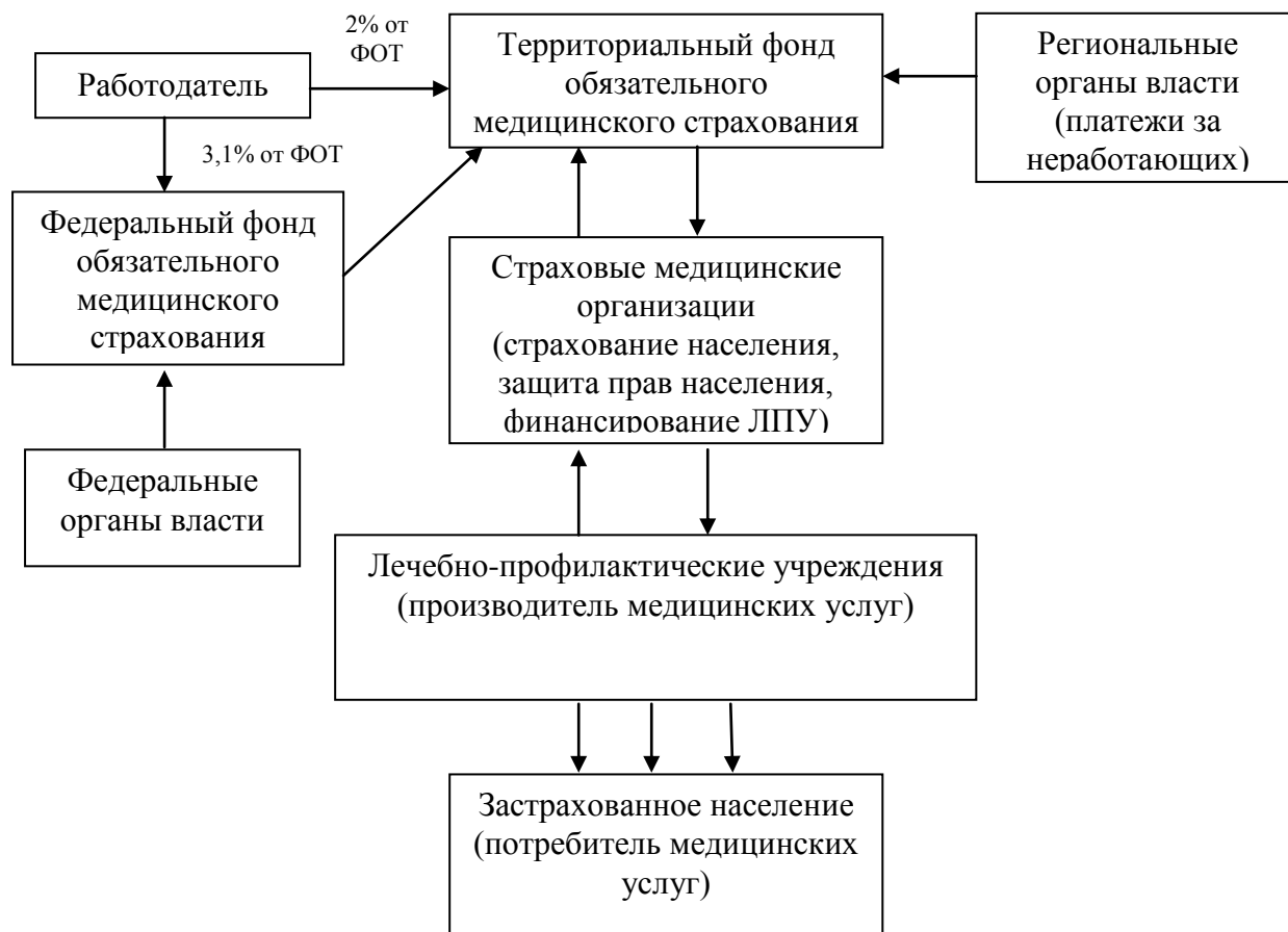
Рис. 2. Структура системы обязательного медицинского страхования[10]