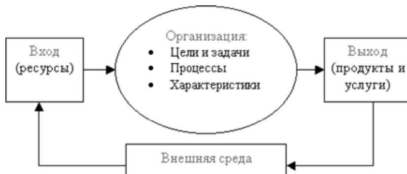
Рис. 1. Компоненты организации как «черного ящика» на основе системного подхода

Взгляд на организацию как на систему позволяет лучше понять основные закономерности деятельности организаций. Изучение характеристик организации является важной ступенью в ее исследовании. Характеристики относятся к специфическим чертам построения организации. Можно сказать, что характеристики описывают организацию точно так же, как личностные или физические черты описывают людей.