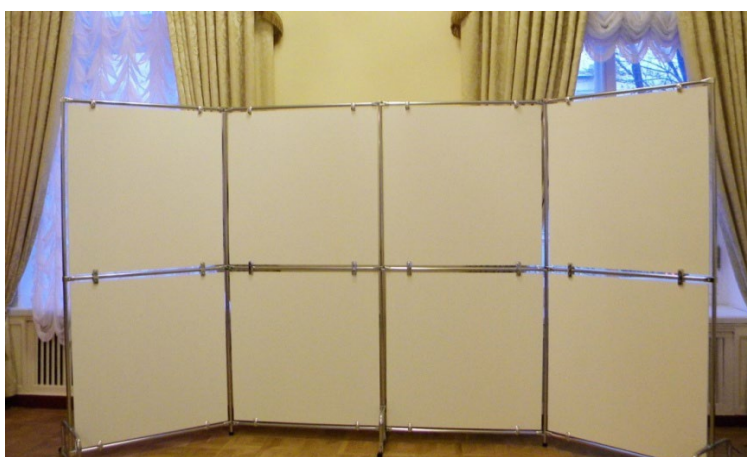
Примерный вариант: Стенд экспозиционный