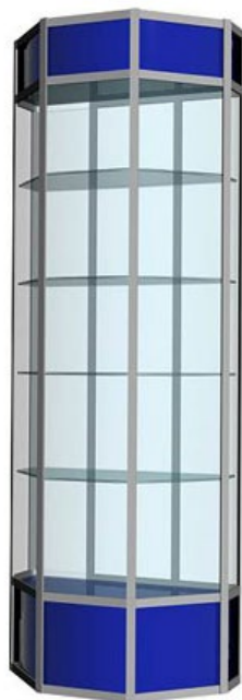
Примерный вариант: Витрина экспозиционная

Рис. 1. Модуль С «Разработка экскурсионных программ обслуживания / экскурсий», Модуль D «Проведение экскурсий»